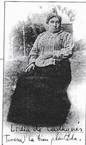
La Ben Plantada de Cadaqués.

Va morir sola el 1946, però abans que tot es tornés en contra seu havia estat elogiada a Cadaqués per la seva creativitat a peu de carrer. Com a exemple, ha perviscut la seva